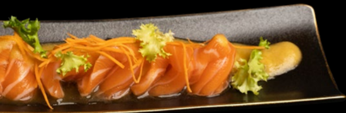
MK001 1 volta per persona Carpaccio tropical Salmone, salsa alla frutta € 13,00