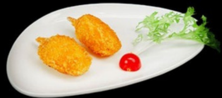
A003 - 3 pz Chele di granchio € 3,00