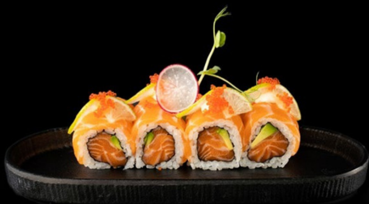
U030 Lime roll Salmone avocado, lime, tobiko, salsa spicy. € 12,00