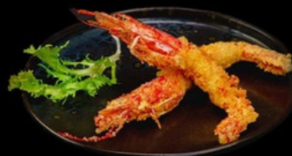
F009 - 3 pz Gamberone fritto € 9,00