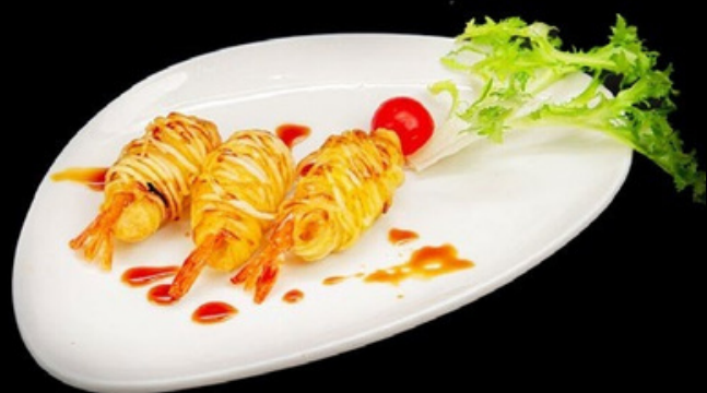
A008 - 3 pz Gamberi patata Gamberi avvolte in fili di patate, sopra salsa teriyaki. € 5,00