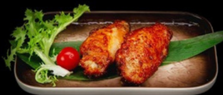
F006 - 3 pz Alette di pollo € 6,00