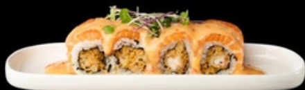
U032 Thai roll Gambero in tempura, salmone, salsa agropiccante. € 12,00