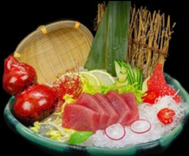
S003 - 5 pz 5 volte per persona Sashimi white € 14,00