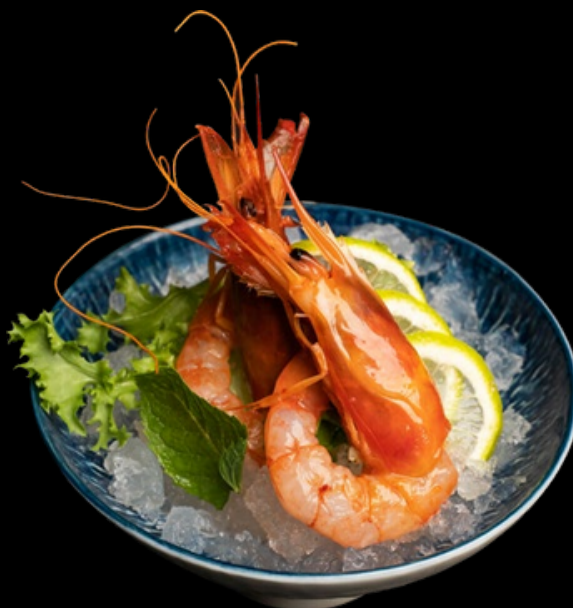
MK004 1 volta per persona Sashimi gambero rosso € 10,00