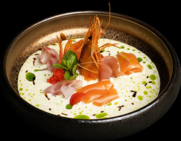
MK002 1 volta per persona Carpaccio special Salmone, tonno, branzino, gambero rosso € 15,00