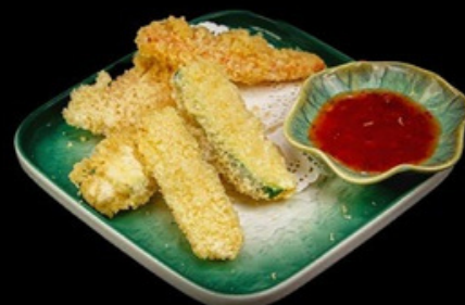
F003 Tempura verdure € 9,00