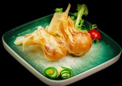
F007 - 3 pz Involtini giapponesi Gamberi, carne, verdura misto € 8,00