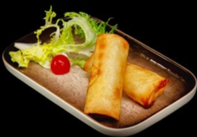
A001 - 3 pz Involtini primavera Cavolo cappuccio, carota, cipolla € 3,00