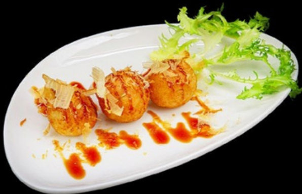
A007 - 3 pz Takoyaki Polpo € 5,00