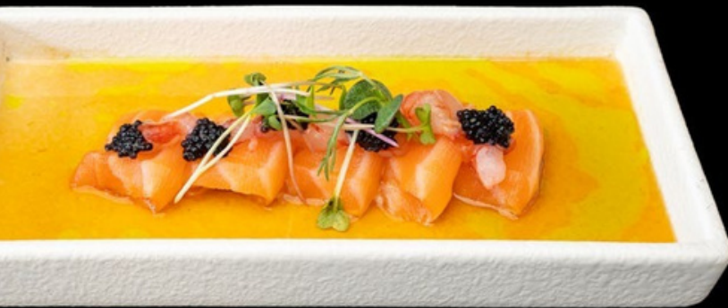
CR001 Carpaccio sake special Salmone, sopra gambero rosso, tobiko, salsa ponzu. € 14,00