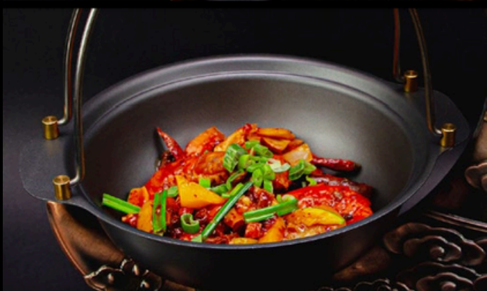
TG003 Gamberone tegamino Manzo, verdura misto, cipolla, salsa piccante. € 11,00