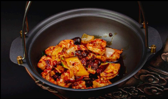
TG001 Gamberi tegamino Gamberi, verdure misto, cipolla, salsa piccante. €11,00