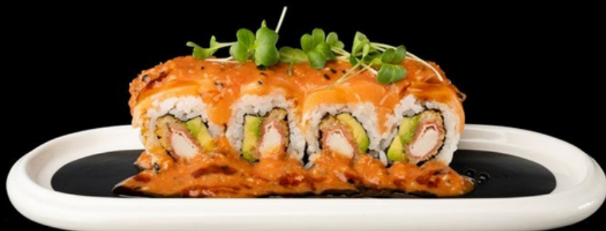
U033 Vulcan roll Surimi in tempura, salmone, avocado, salsa special. € 12,00