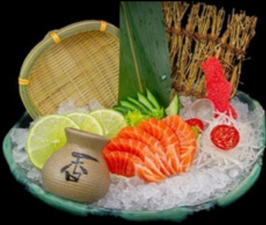
S001 - 5 pz 5 volte per persona Sashimi sake € 12,00