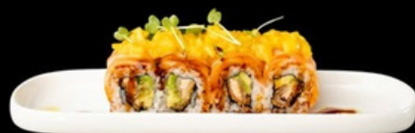
U031 Summer roll Salmone in tempura, salmone, ananas. € 12,00