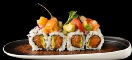
U027 Ceviche roll Salmone, avocado, tartare mista. € 12,00