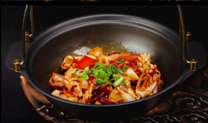
TG004 Calamari tegamino Calamari, verdure misto, salsa piccante. € 9,00