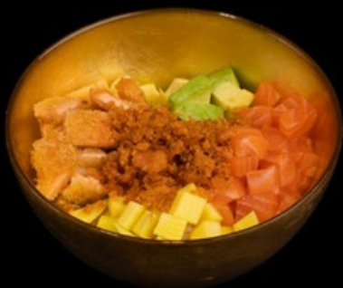
PK001 Poke sake Riso, salmone, avocado, mango, salmone fritto, s. teriyaki € 14,00