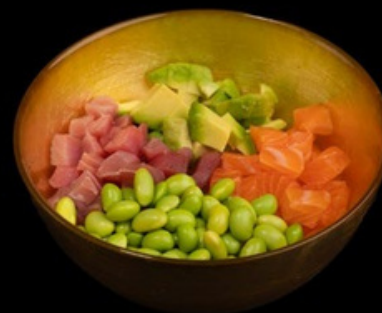
PK003 Poke mix Salmone, tonno, avocado, edamame, s. teriyaki € 14,00