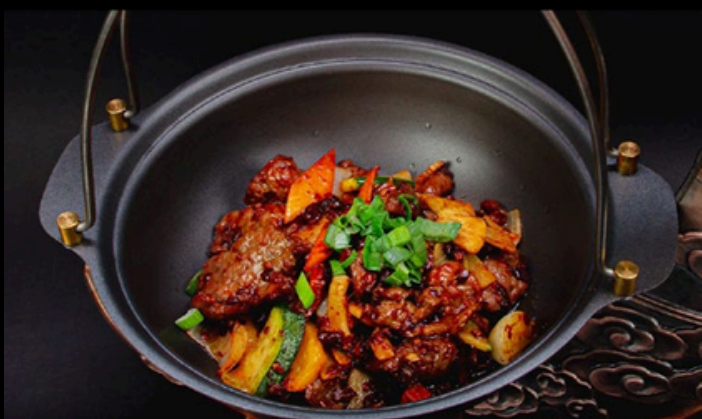
TG002 Manzo tegamino Manzo, verdura misto, cipolla, salsa piccante. € 9,00