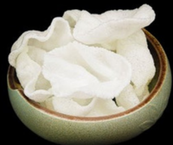
A006 Nuvolette di ebi € 3,00