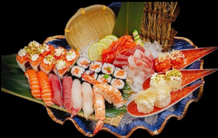
S006 - 30 pz Royal sushi mix € 40,00