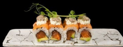
U029 Sake truffle roll Salmone, avocado, philadelphia, salsa tartufo. € 12,00