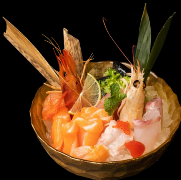
MK003 1 volta per persona Sashimi misto Salmone, tonno, branzino, gambero rosso, scampi € 15,00