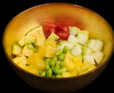
PK002 Poke veg Riso, verdure miste, sesamo. € 14,00