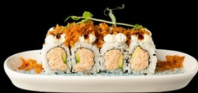
U028 Sakebushi roll Salmone cotto, avocado, philadelphia, salmone croccante. € 12,00